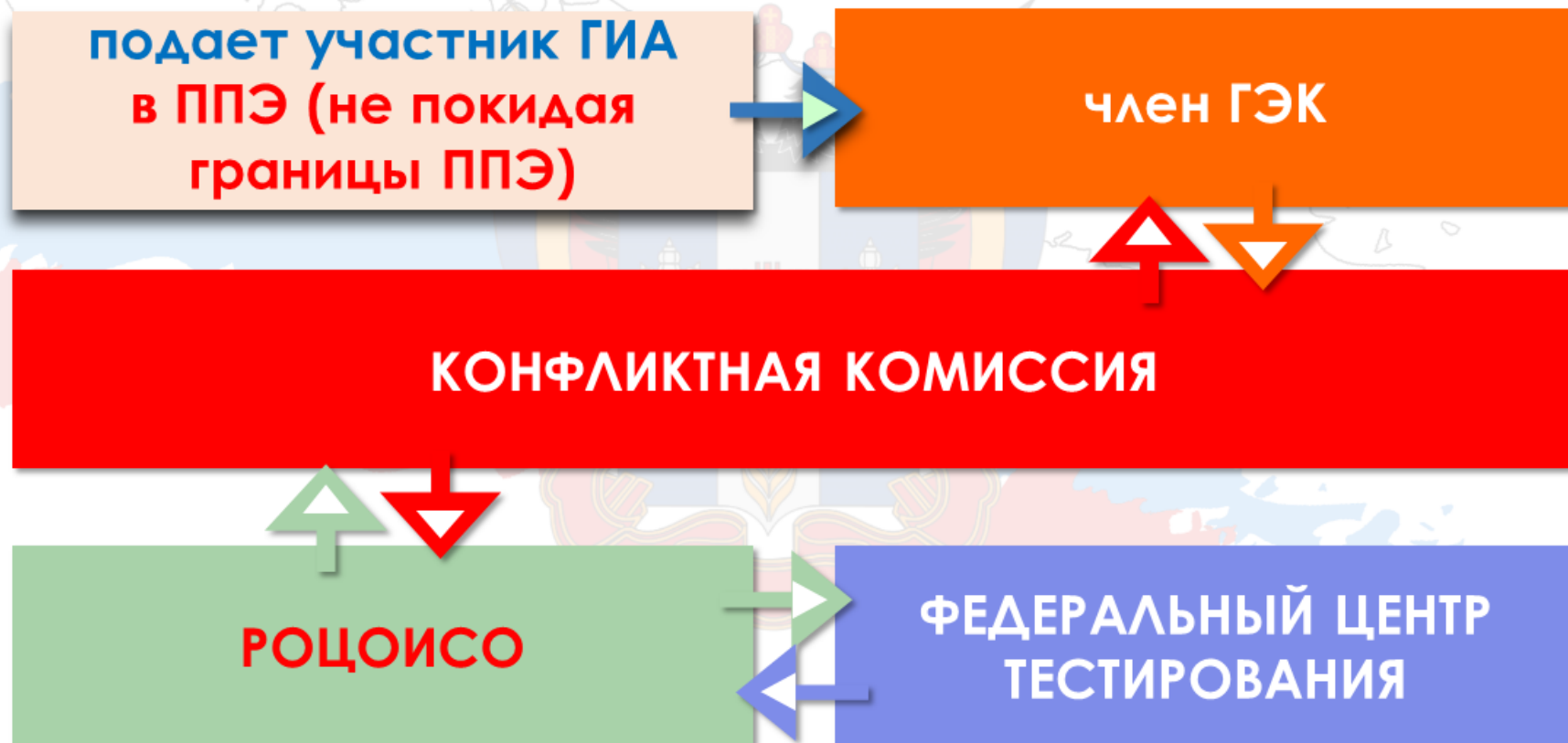
СХЕМА РАССМОТРЕНИЯ АПЕЛЛЯЦИИ О НАРУШЕНИИ ПОРЯДКА